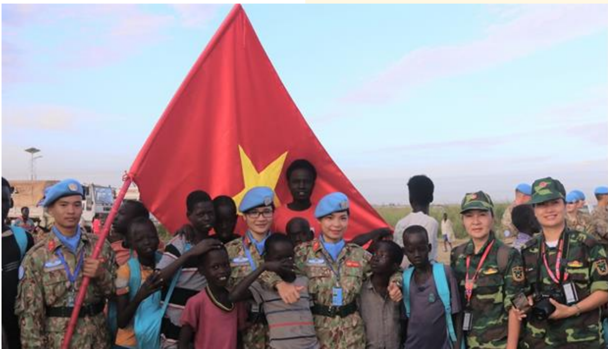
Forces onusiennes de maintien de la paix du Vietnam

Enfin, ces dernières années, le Vietnam s'est révélé être un membre de plus en plus actif de la communauté internationale en contribuant, notamment, aux opérations de maintien de la paix et à l'Agenda pour la paix et la sécurité des femmes du Conseil de sécurité de l'ONU. Il est devenu un pays contributeur de troupes militaires en 2014 et de policiers en 2022. Le Vietnam déploie actuellement du personnel auprès de la Force intérimaire de sécurité des Nations unies pour Abyei (FISNUA), de la Mission des Nations unies au Soudan du Sud (MINUSS) et de la Mission multidimensionnelle intégrée des Nations unies pour la stabilisation au Mali (MINUSMA).