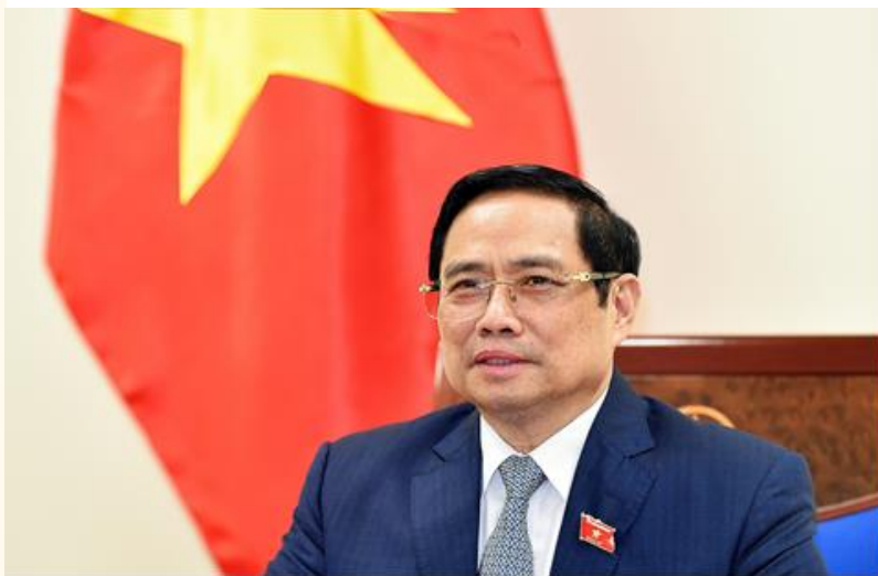
Le Premier ministre M. Pham Minh

Le Premier ministre vietnamien Monsieur Pham Minh Chinh effectuera une visite de travail au Royaume de Belgique du 13 au 15 décembre 2022 durant laquelle il participera au sommet UE-ASEAN pour célébrer 45 ans de relations bilatérales, le 14 décembre. Quelques jours auparavant, du 9 au 10 décembre, il sera également en visite officielle au Grand-Duché de Luxembourg. Ces séjours du Premier ministre du Vietnam dans deux pays du Benelux constitueront le coup d'envoi du 50e anniversaire des relations diplomatiques Vietnam-Belgique et Vietnam-Luxembourg (1973-2023).